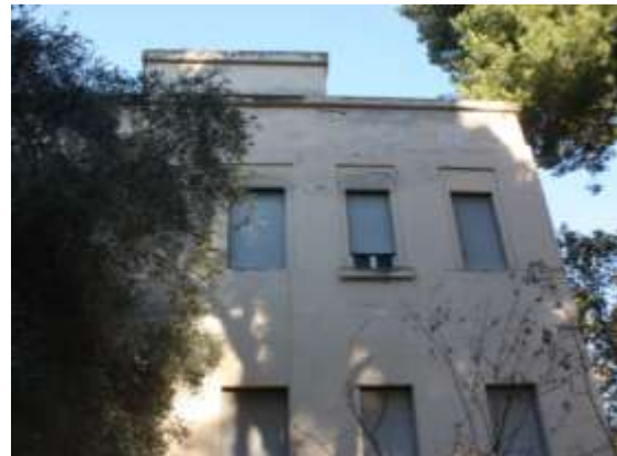
Viste cordolo di coronamento