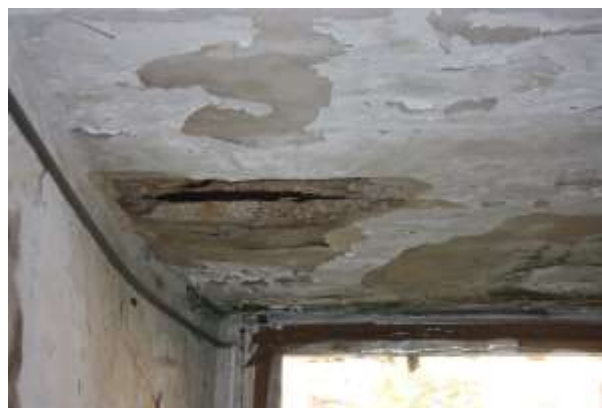
Patologie di degrado