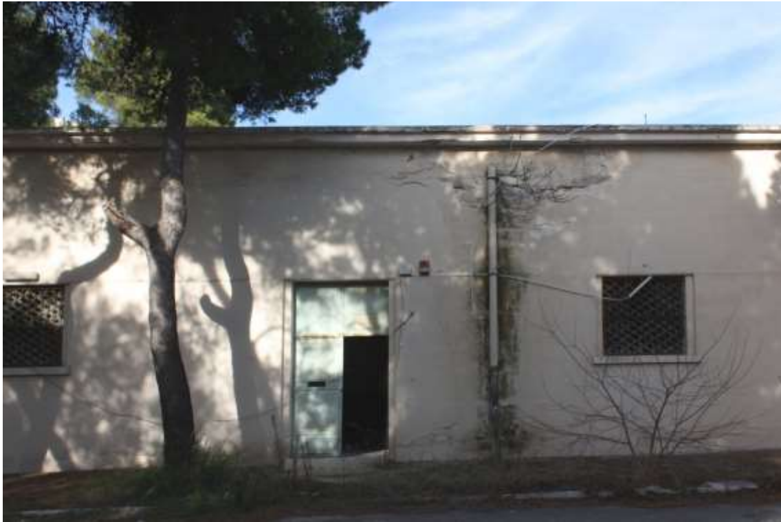
Vista di dettaglio prospetto Sud