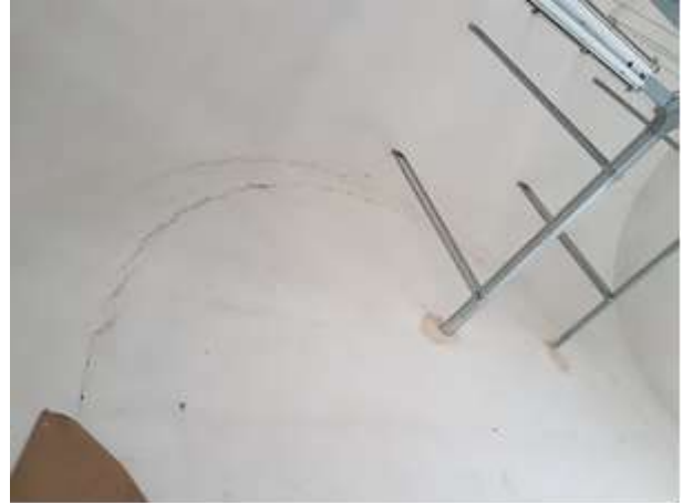
Patologie di degrado