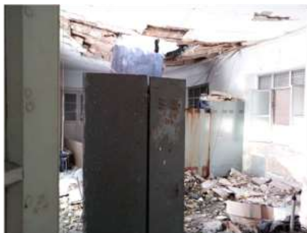
Patologie di degrado