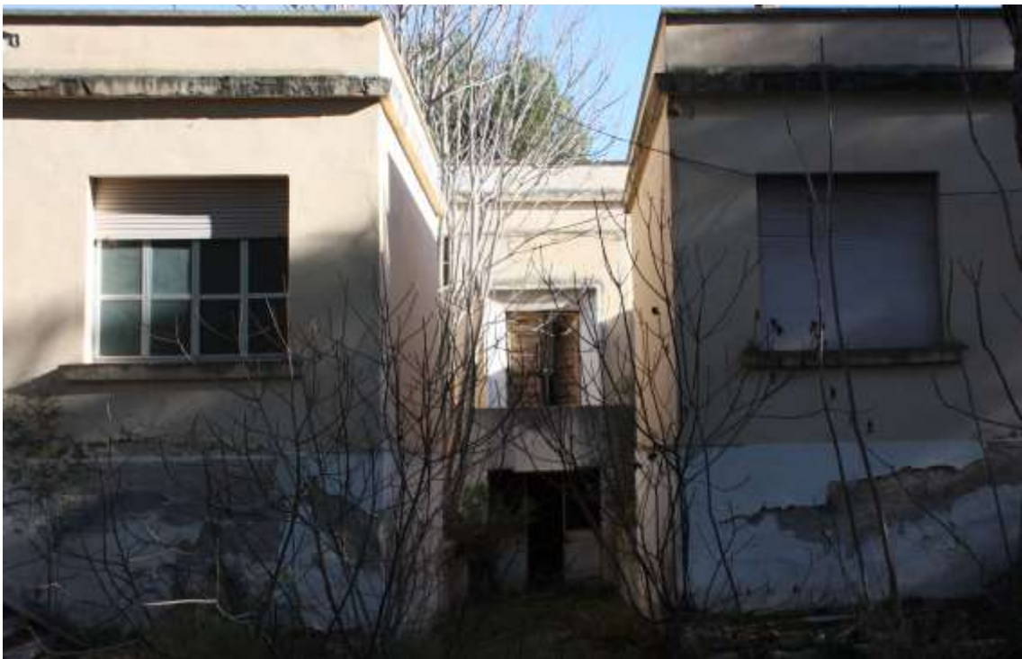
Vista corte interna