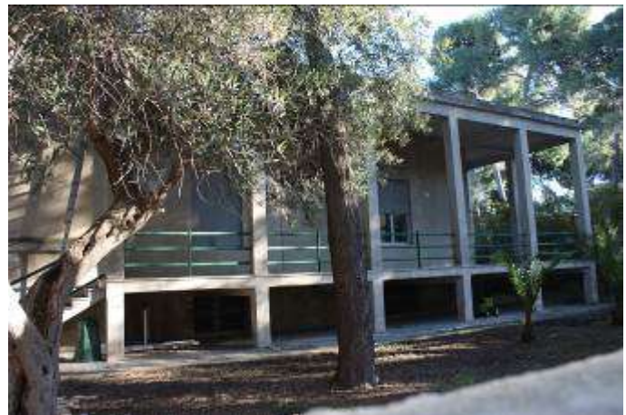
Patii esterni in c.a.

Dal punto di vista strutturale le caratteristiche principali del Padiglione, edificato tra il 1936 e il 1940, sono risultate le seguenti: