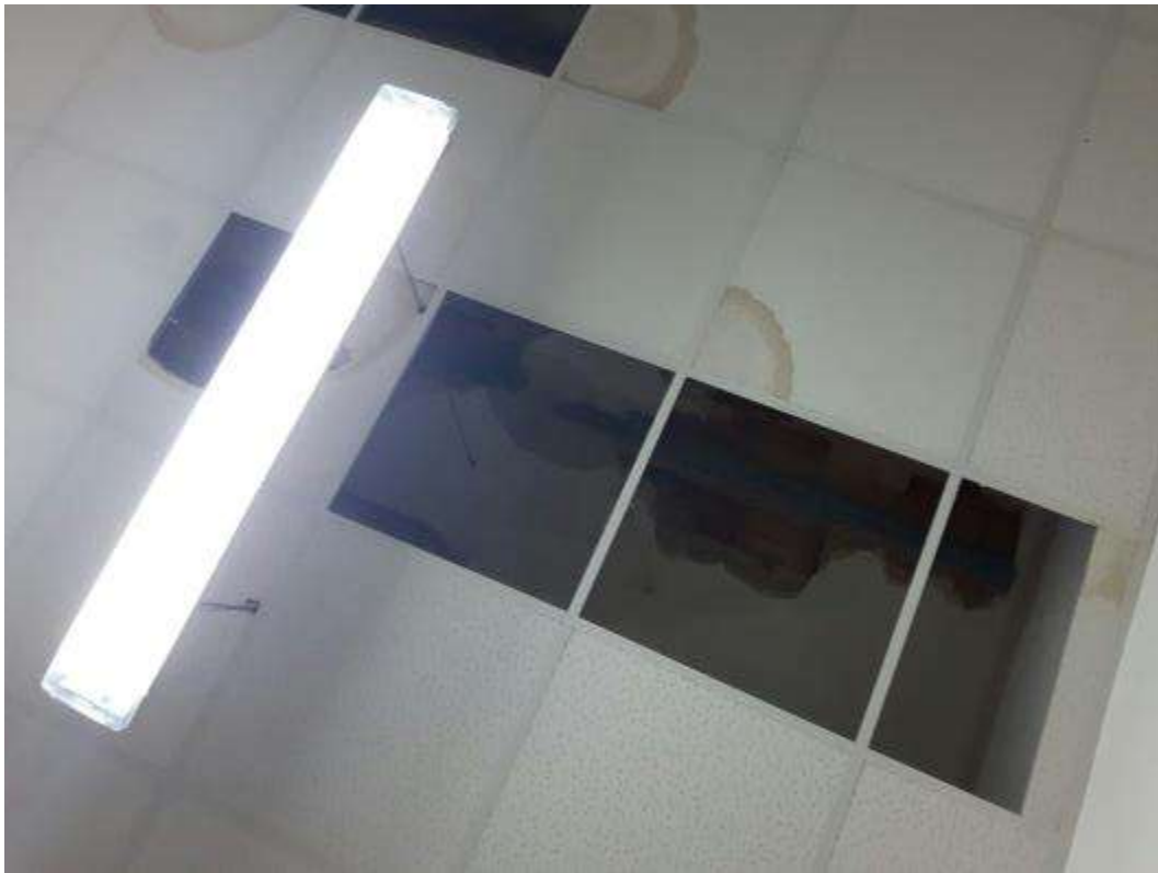
Patologie di degrado