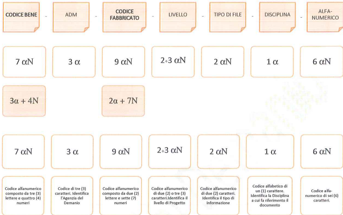
Esempio di codifica dei modelli

Di seguito è riportata lo schema tipico della codifica su citata a titolo esemplificativo e non esaustivo: