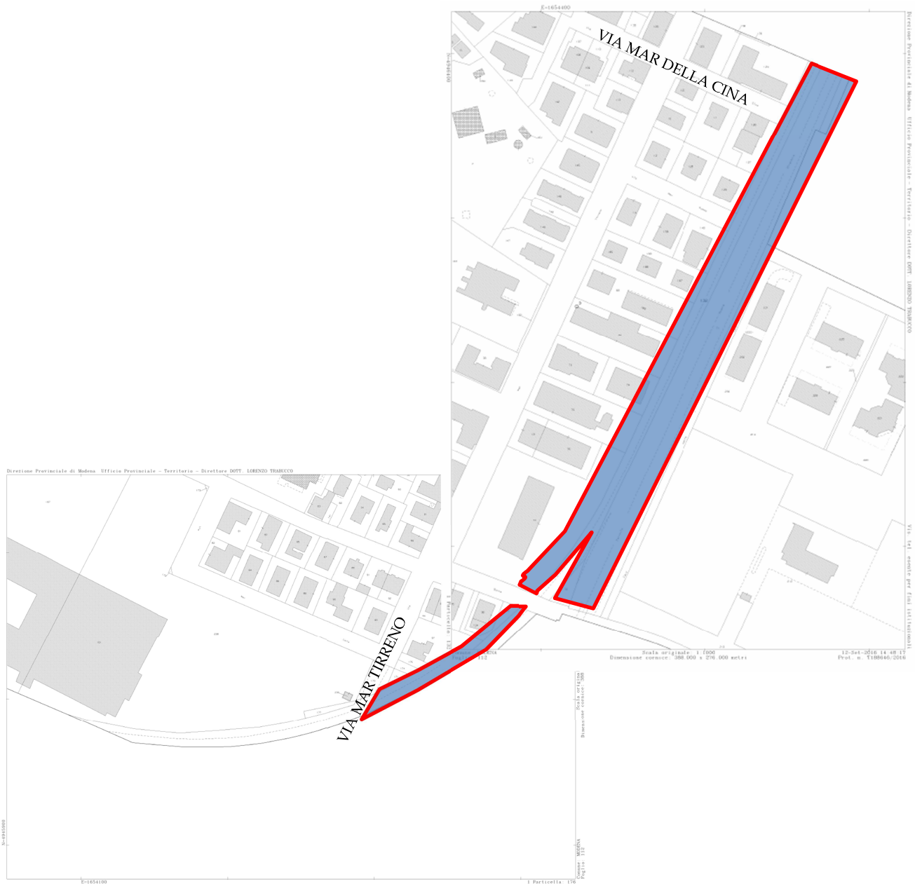
Estratto di mappa catastale Comune di Modena fig. 112 particelle 71, 132 (in alto) e 176/parte (in basso)