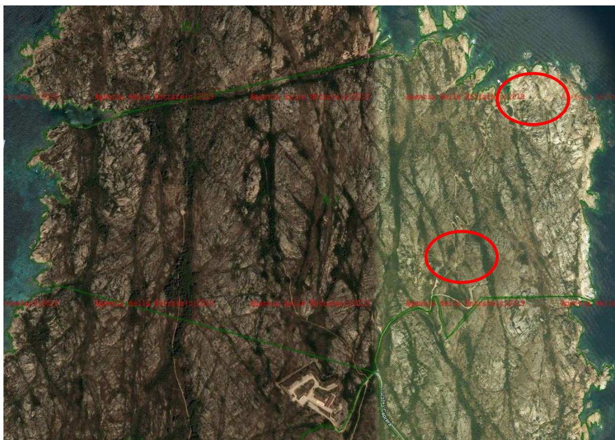
Figura 1 – Individuazione delle batterie di Messa del Cervo e Candeo nel mappale 35

All'interno dello stesso mappale è ricompresa anche una seconda batteria, antinave, armata dalla Marina tra la prima e la seconda guerra mondiale e intitolata al capitano di fregata Antonio Candeo.