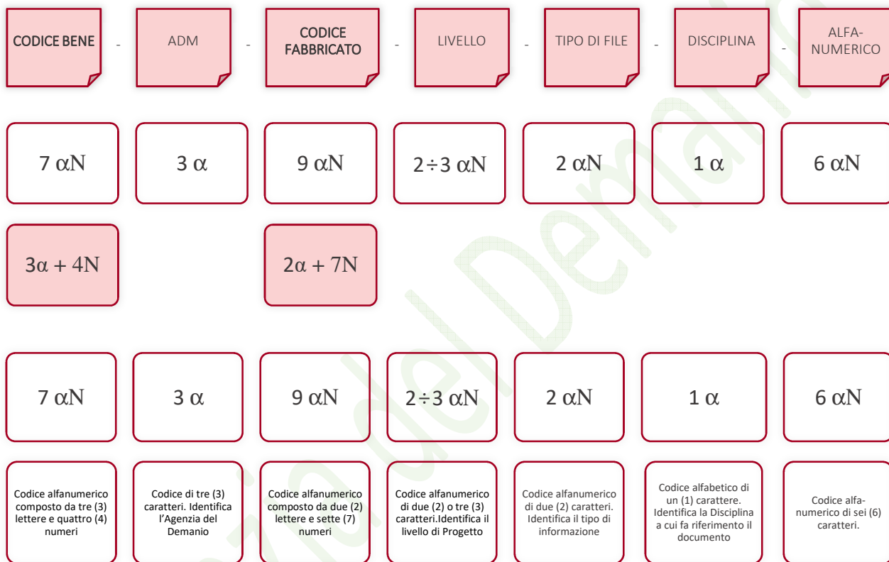
Esempio di codifica dei modelli

Di seguito è riportata lo schema tipico della codifica su citata a titolo esemplificativo e non esaustivo: