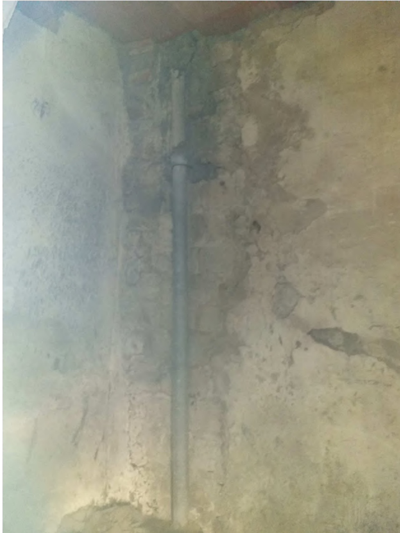
Foto 6 – Una tubazione, presubilmente in MCA, rinvenuta all'interno del locale n.49

Le foto dalla n. 7 alla n. 30 documentano la presenza di rifiuti all'interno dei locali del piano terra.