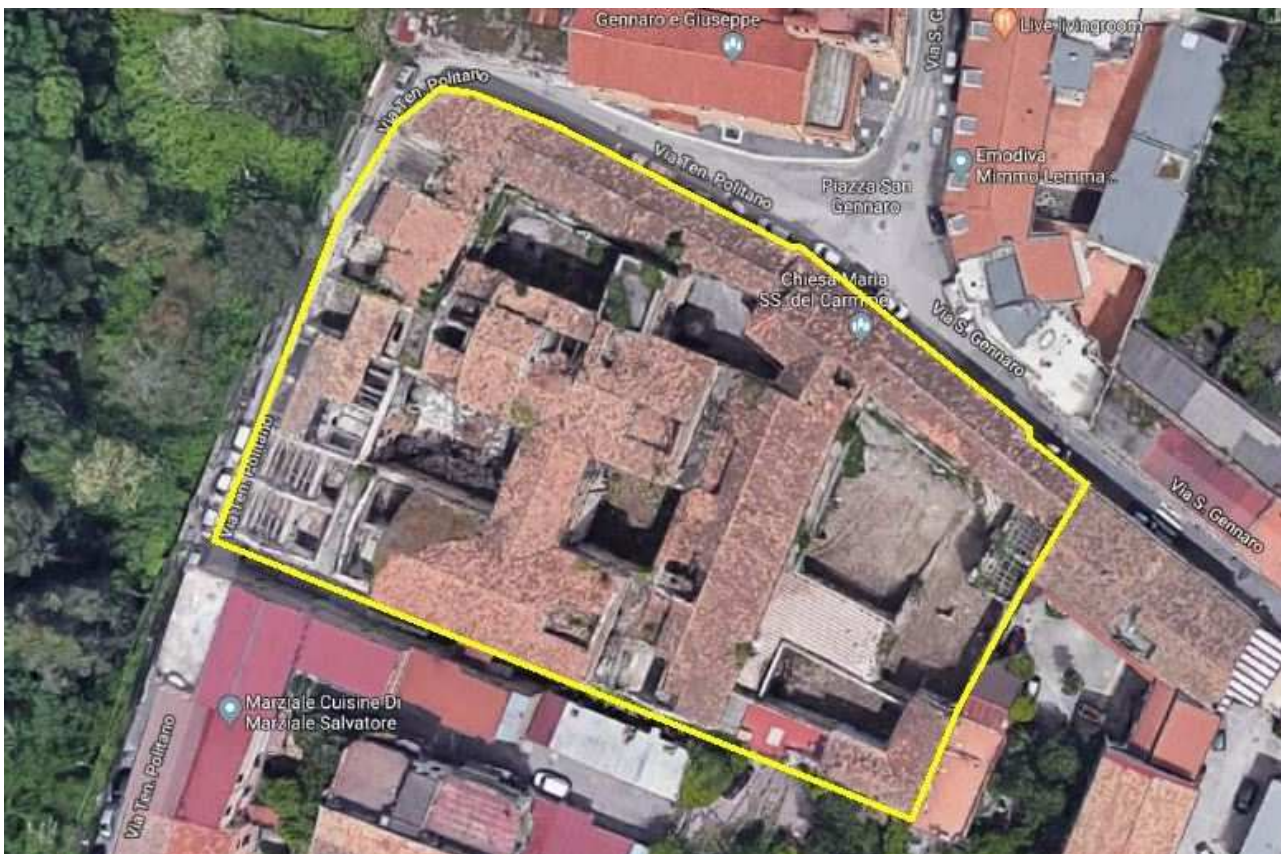
Inquadramento del bene