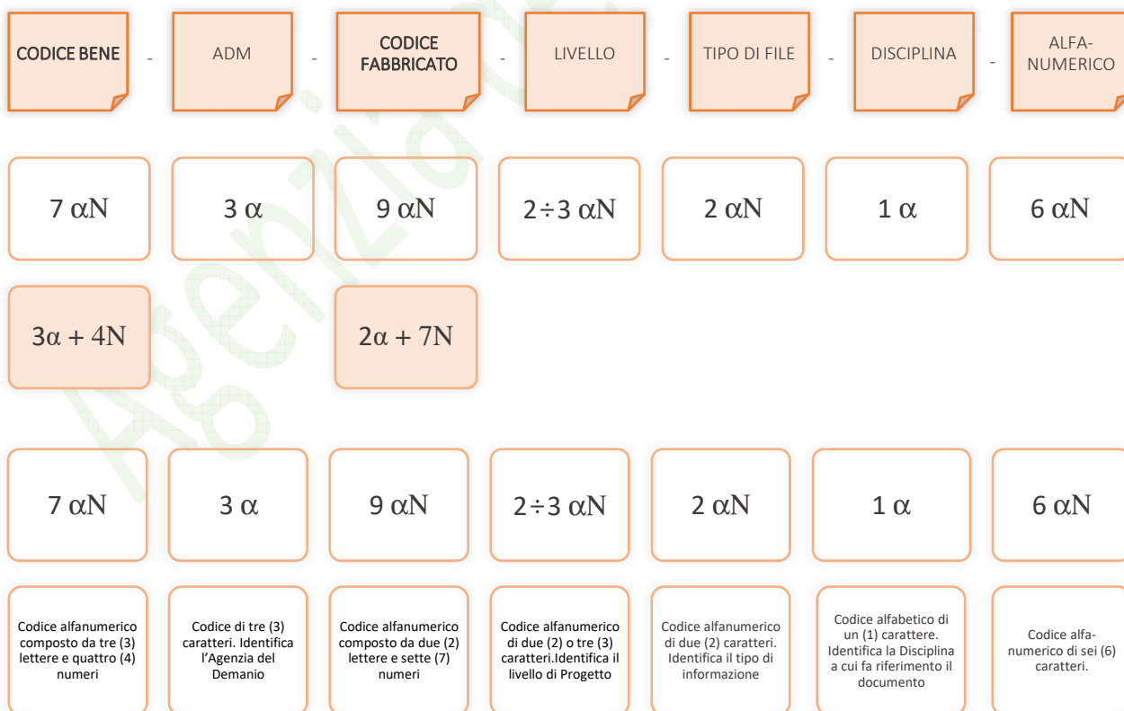
Esempio di codifica dei modelli

Di seguito è riporta lo schema tipico della codifica su citata a titolo esemplificativo e non esaustivo: