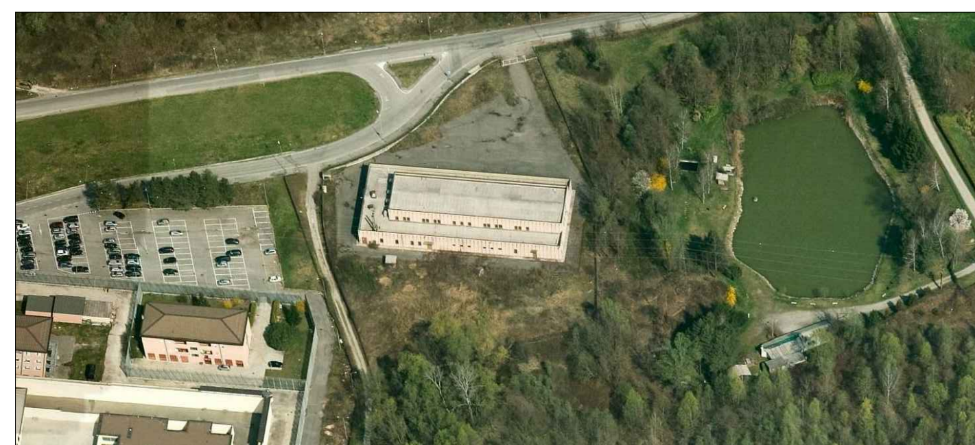
PROPOSTA DI INTERVENTO

RIFUNZIONALIZZAZIONE SPAZI PER ALLOCAZIONE MOTORIZZAZIONE CIVILE