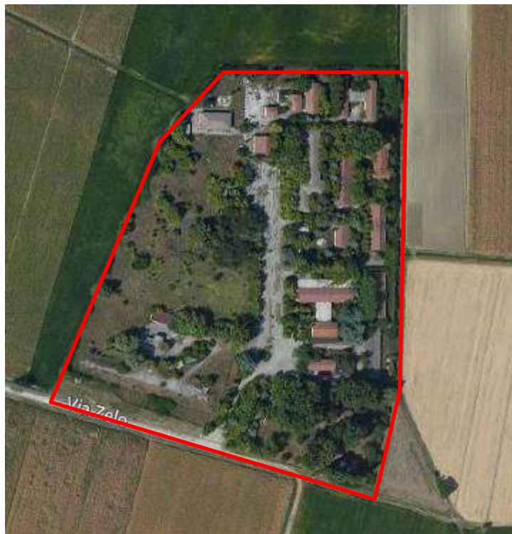
Fig. 2 - Fotografia aerea