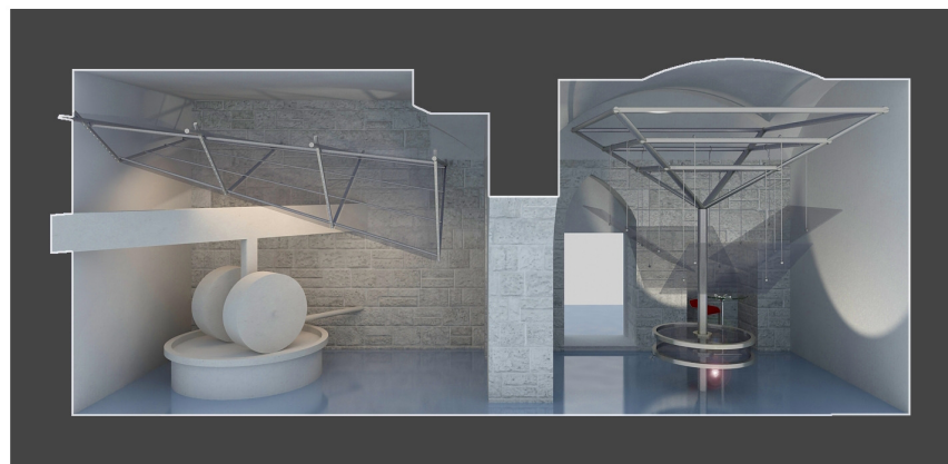
2. Immagine 3d tratta dal : " Progetto del museo della cultura e tradizioni locali, le Macine, Palazzo Carunchio ". Gissi (CH), ITALIA