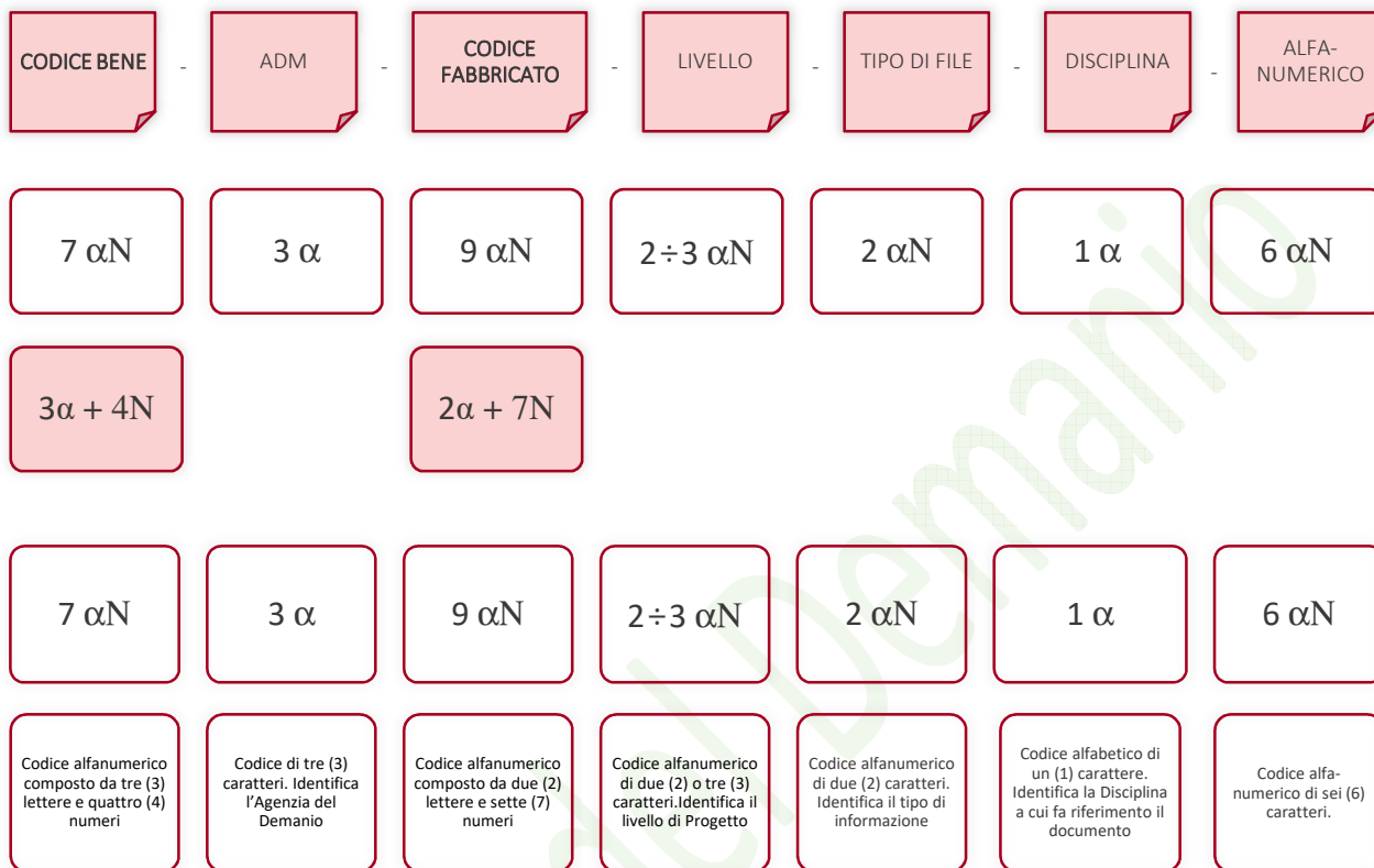
Esempio di codifica dei modelli

Di seguito è riportata lo schema tipico della codifica su citata a titolo esemplificativo e non esaustivo: