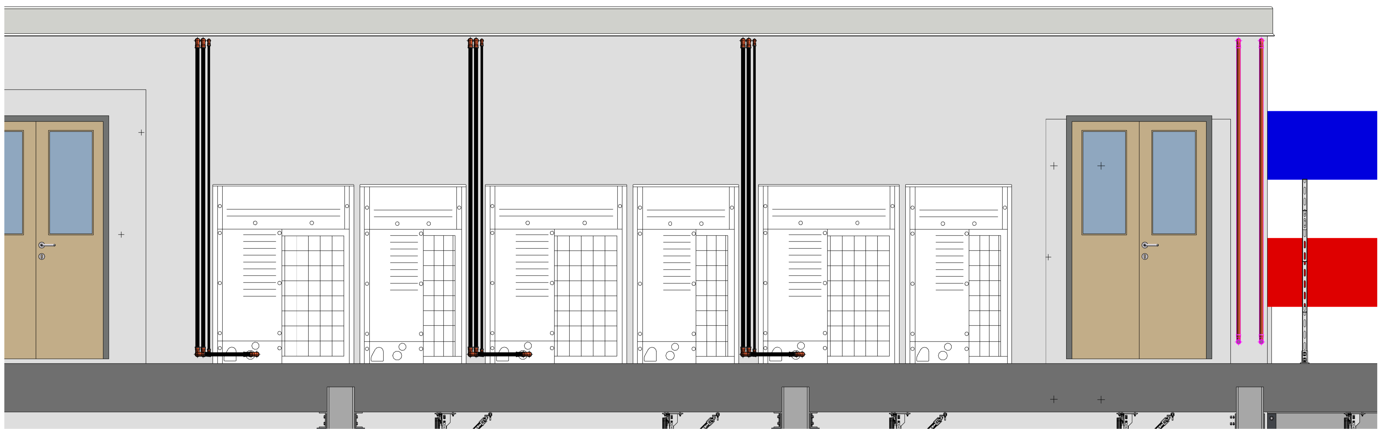
5 Sezione COPERTURA 2 1:20