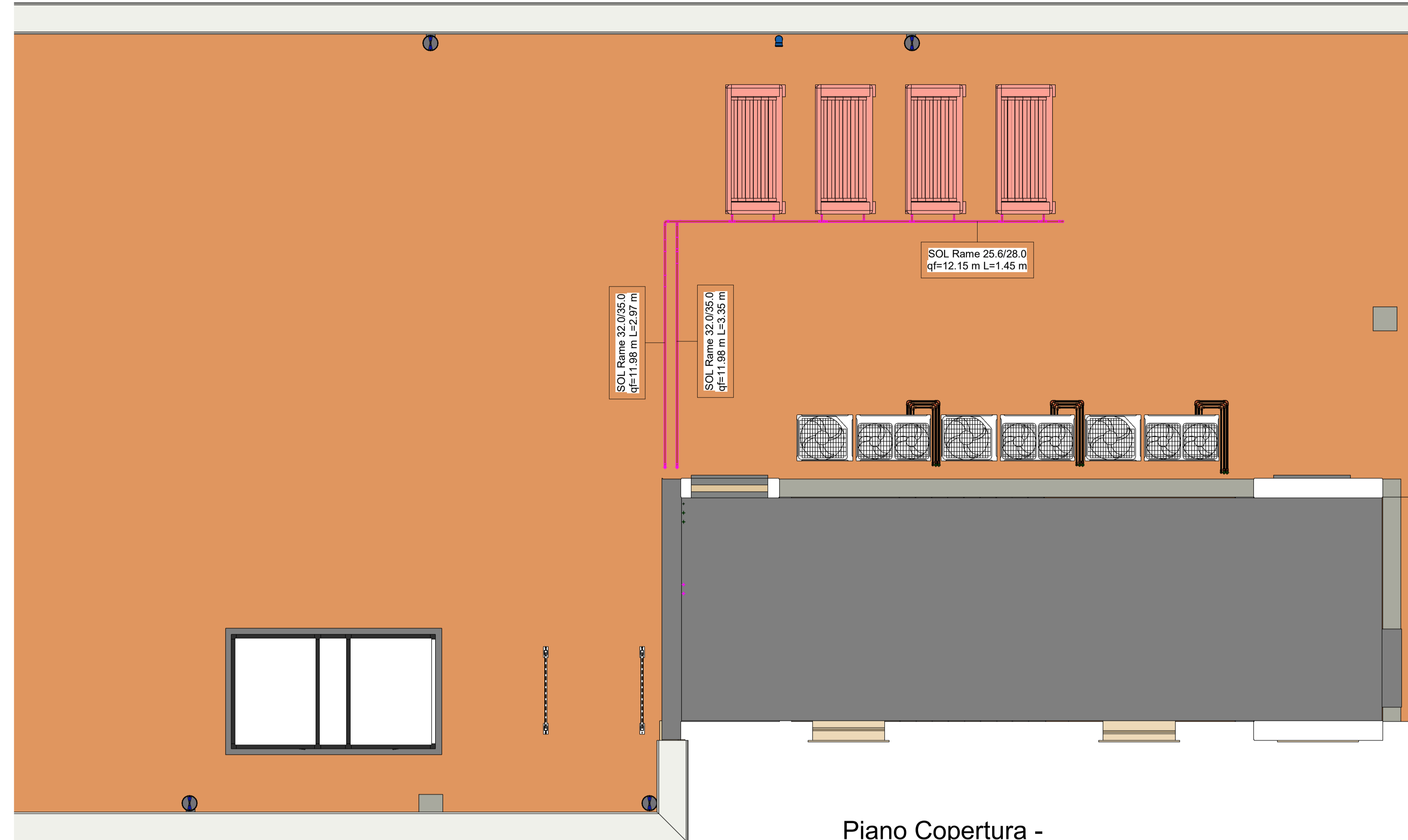
2 Piano Copertura - DETTAGLIO IDS 1:50

AICIA Engineering s.r.l. Sede: Via Roma n. 10 - 83030 Montefalcione (Av.) Tel: +39 0822 27123 - www.aicciaengineering.it e-mail: aiccia@aiccia.com - info@aicciaengineering.it - aiccia@pec.it P. IVA: 024556045 - Capitale sociale € 10.000,00 Iscritta al R.E.A. della C.C.I.A.A. di Avellino n. 158432 ASSOCIATO oice Consorzio delle professioni di ingegneria, architettura e di collaborazione di ingegneria