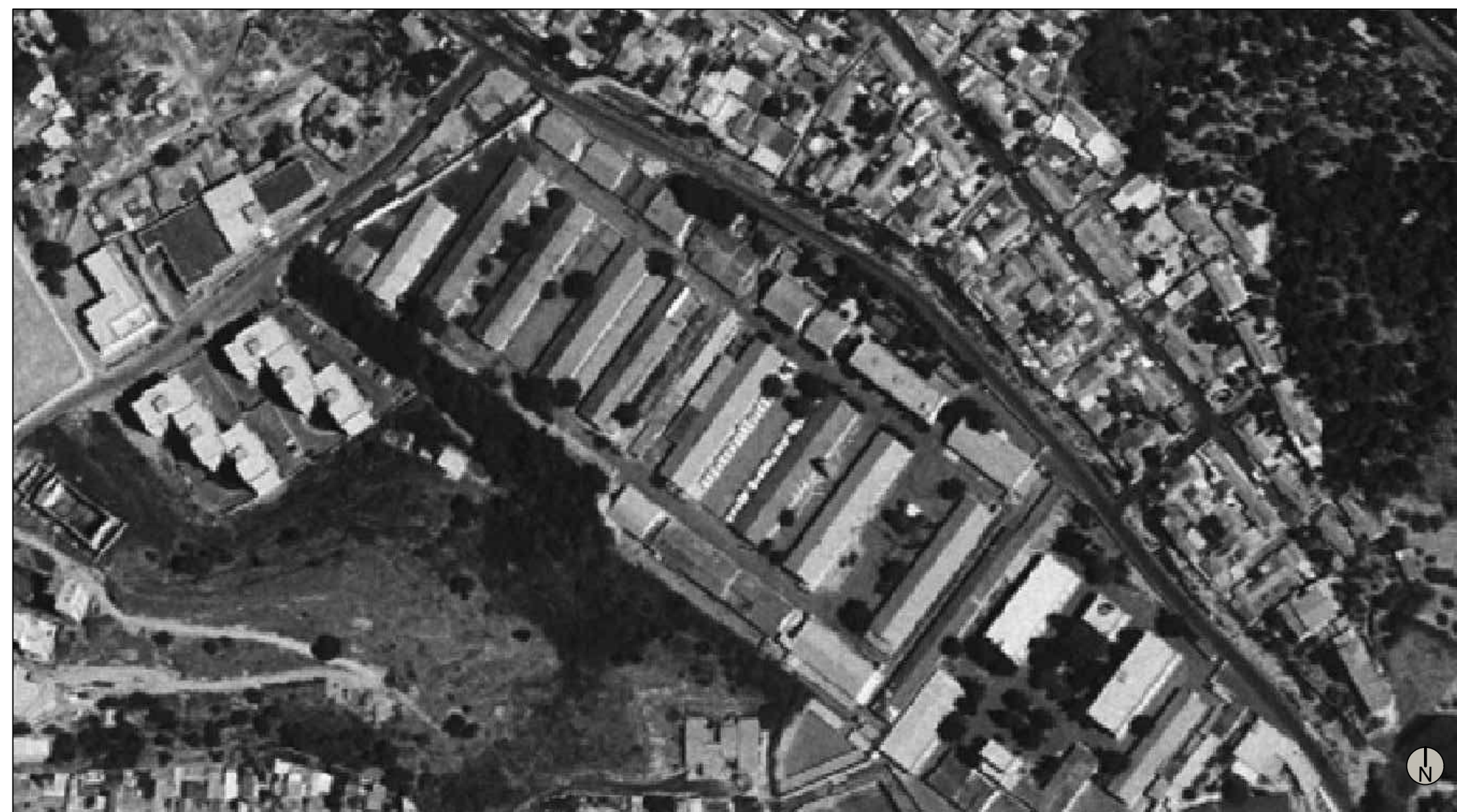
COMUNE DI MESSINA - Stralcio Ortofoto Volo Anno 1994 Scala 1:2.000