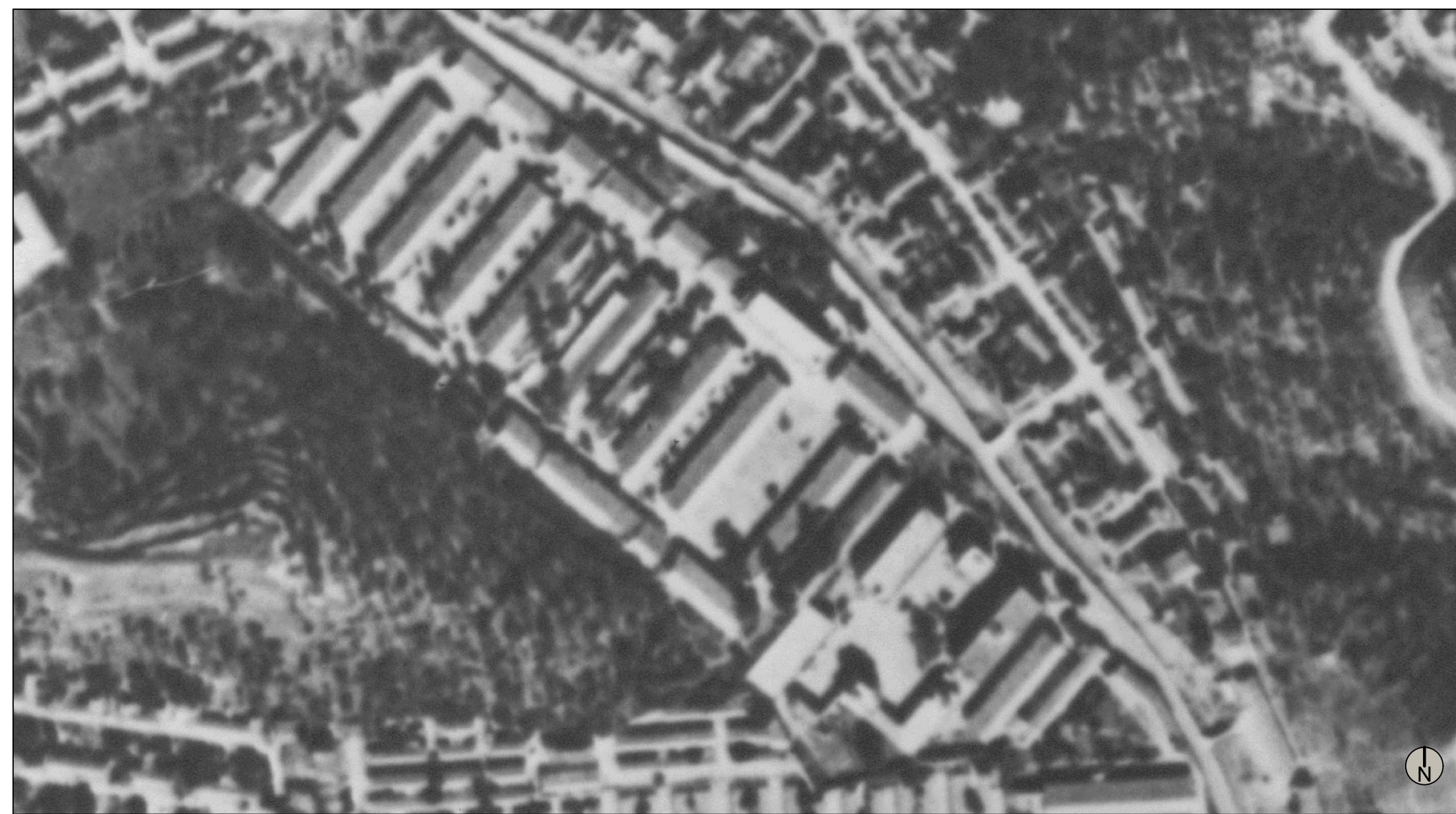
COMUNE DI MESSINA - Stralcio Ortofoto Volo 21.10.1954 (fonte IGM di Firenze serie 3 Fotogramma 5502) Scala 1:2.000