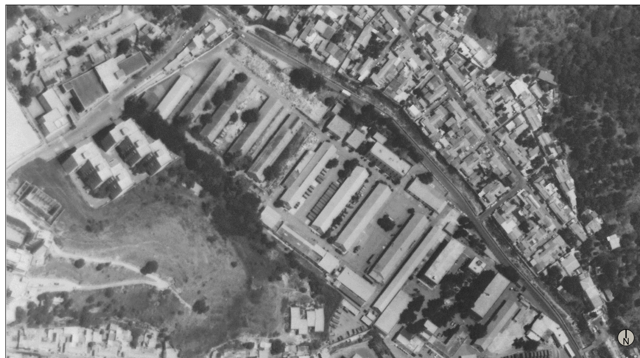
COMUNE DI MESSINA - Stralcio Ortofoto Volo 06.07.2005 (fonte IGM di Firenze serie 19 Fotogramma 4025) Scala 1:2.000