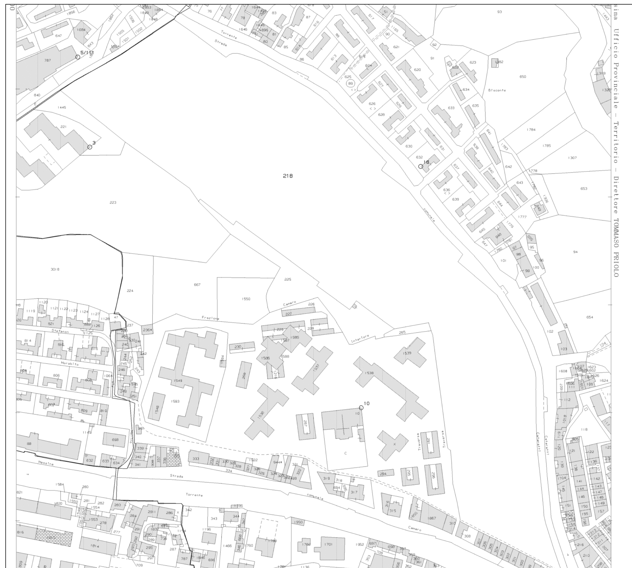
COMUNE DI MESSINA - Stralcio Foglio di Mappa n.119 - Attuale Scala 1:2.000