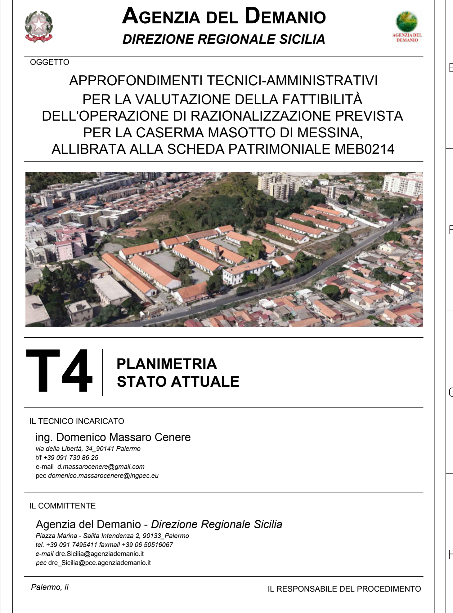
Planimetria Generale scala 1:500

N.B.: Le misure sopra riportate sono da intendersi indicative, in quanto non sono frutto di un rilievo geometrico di dettaglio, ma derivano dalle informazioni assunte attraverso l'esame della documentazione acquisita presso i vari Uffici, pertanto, esse vanno verificate sui luoghi prima di procedere con le successive fasi di progettazione.