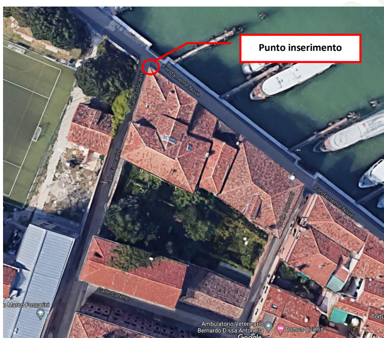
Figura 1 Vista aerea dell'edificio

La posizione geografica espressa nel sistema WGS84 del punto distintivo del progetto per quanto riguarda l'edificio in oggetto risulta: