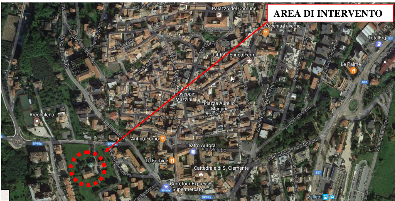
Fig. 01 (Inquadramento territoriale – fuori scala)

Il compendio demaniale oggetto di intervento, conosciuto oggi come "Casermaccia" è costruito sulla sommità di un rilievo nella zona sud-est del centro storico della città di Velletri, in una posizione che gode di una vista che giunge fino al mare dove si intravede il promontorio del Circeo. Il complesso confina a nord con proprietà privata, ad est con la chiesa di San Francesco, a sud con piazza S. Francesco ed a ovest con via di Ponente.