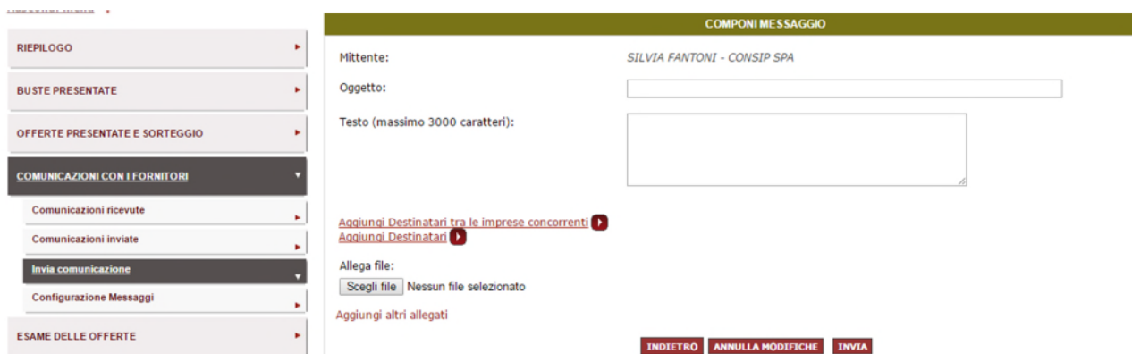
Figura 6 - Invio comunicazione