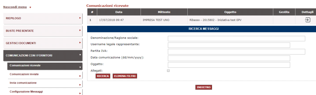
Figura 4 - Comunicazioni con i fornitori

Selezionando dal sotto menù Comunicazioni ricevute è possibile monitorare le richieste di chiarimento. Accedendo ai Dettagli della singola comunicazione ricevuta, puoi visualizzare il testo della comunicazione ed eventuali allegati e, attraverso la copia del testo e il download di eventuali documenti allegati, trasmetterli extra Sistema all'ufficio competente.