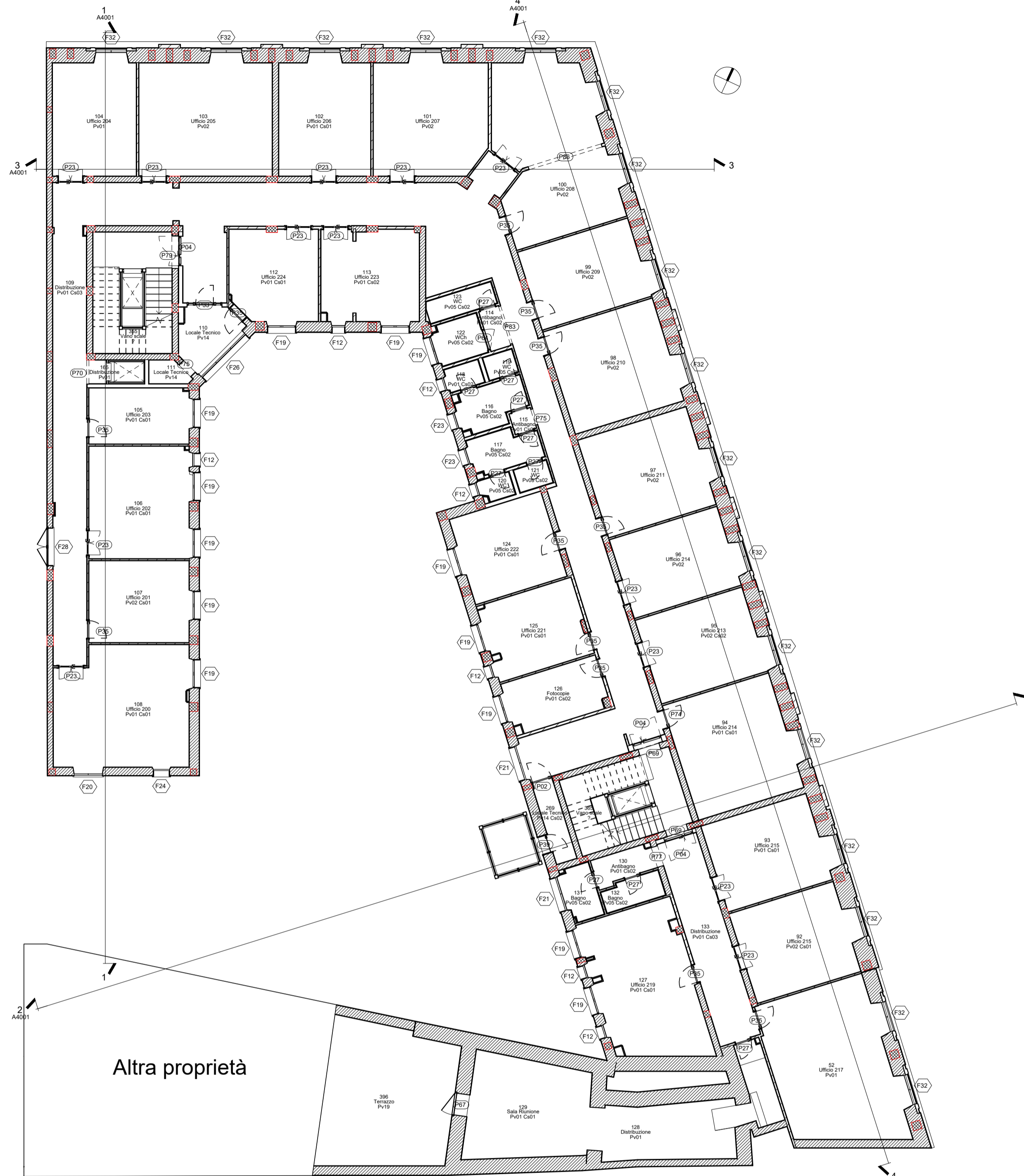
A_02_Funzionale Scala 1:100