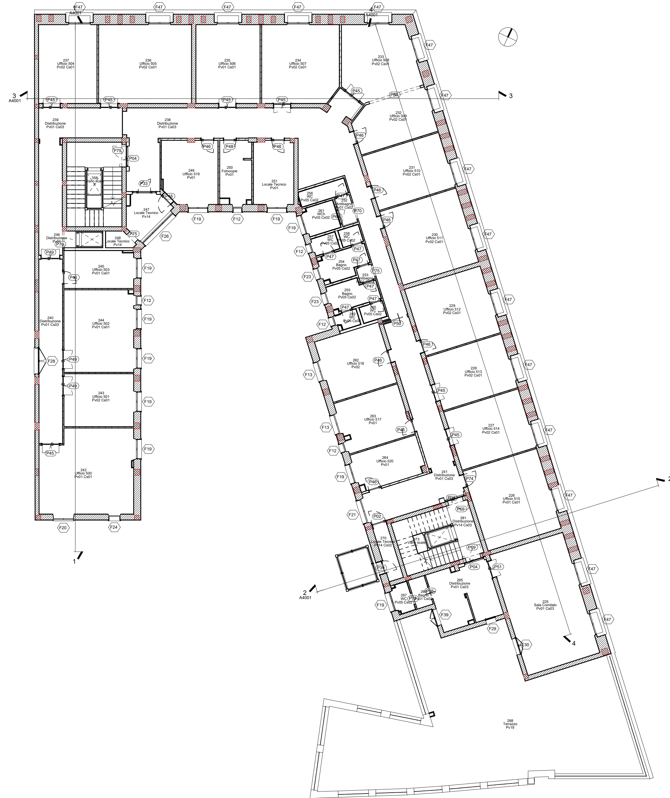
A_05_Funzionale Scala 1:100