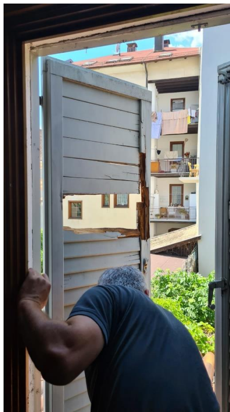
Rimozione imposta al primo piano del fabbricato