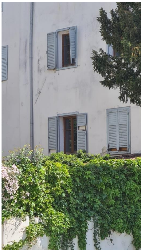
Le imposte degradate sul lato del cortile in pericolo di crollo