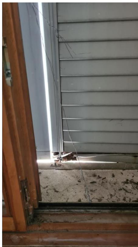
Bloccaggio imposta con filo di ferro