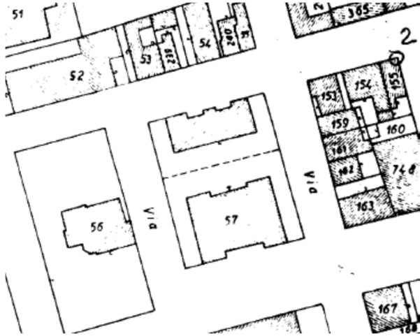
estratto foglio 39 vecchie mappe