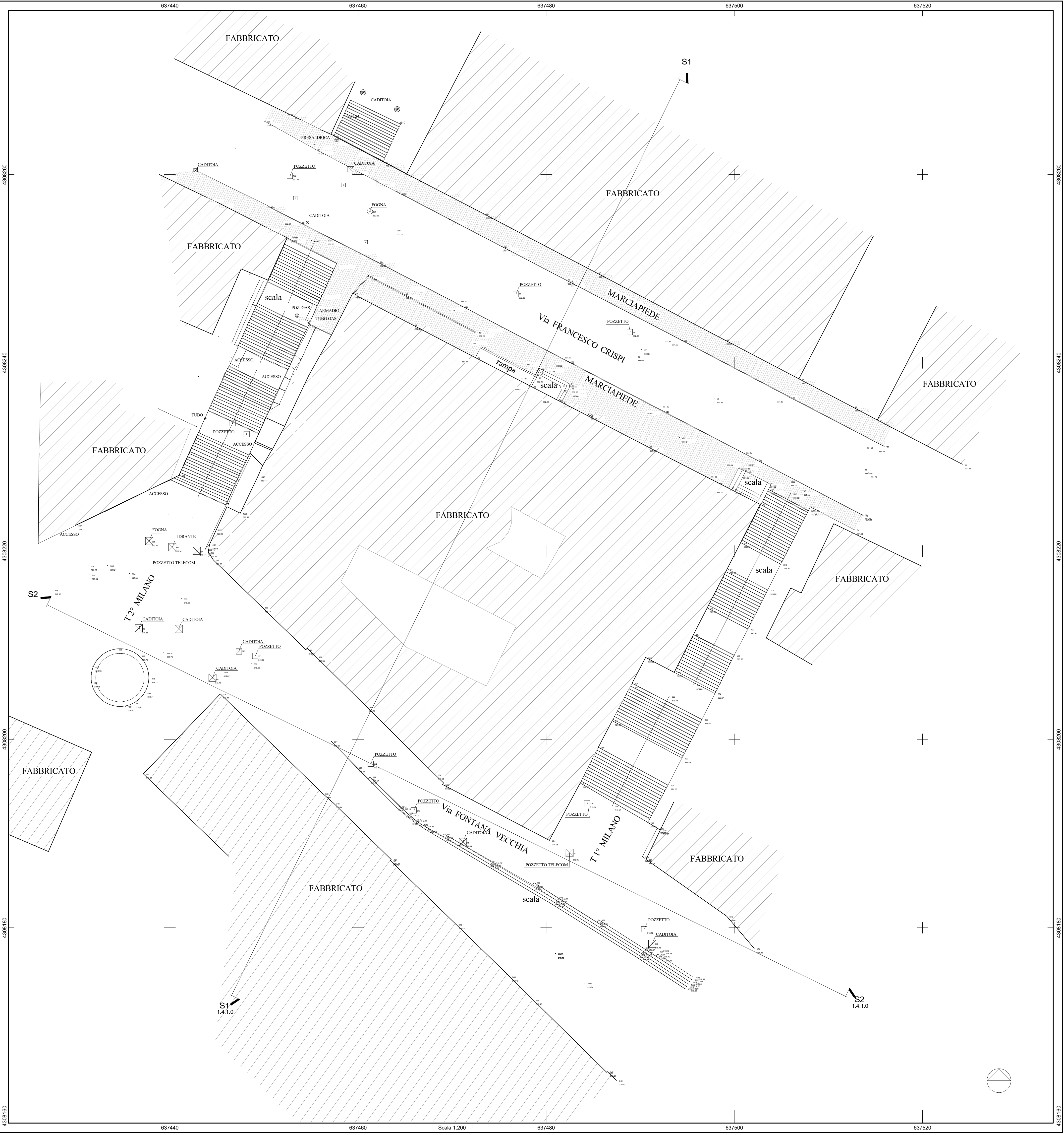
Topografia 1 : 200