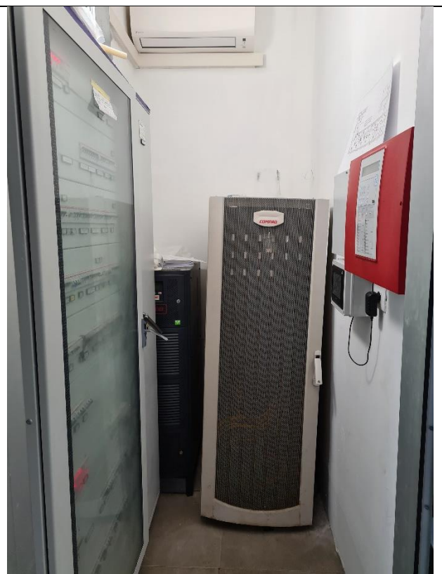
Sistema rack oggetto di spostamento