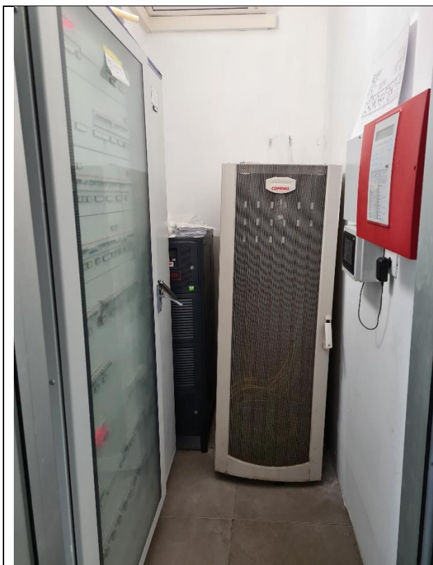
Sistema rack oggetto di spostamento

Di seguito si riportano le fotografie del sistema-rack da spostare nonché la planimetria ove si evince la posizione attuale e futura dello stesso.