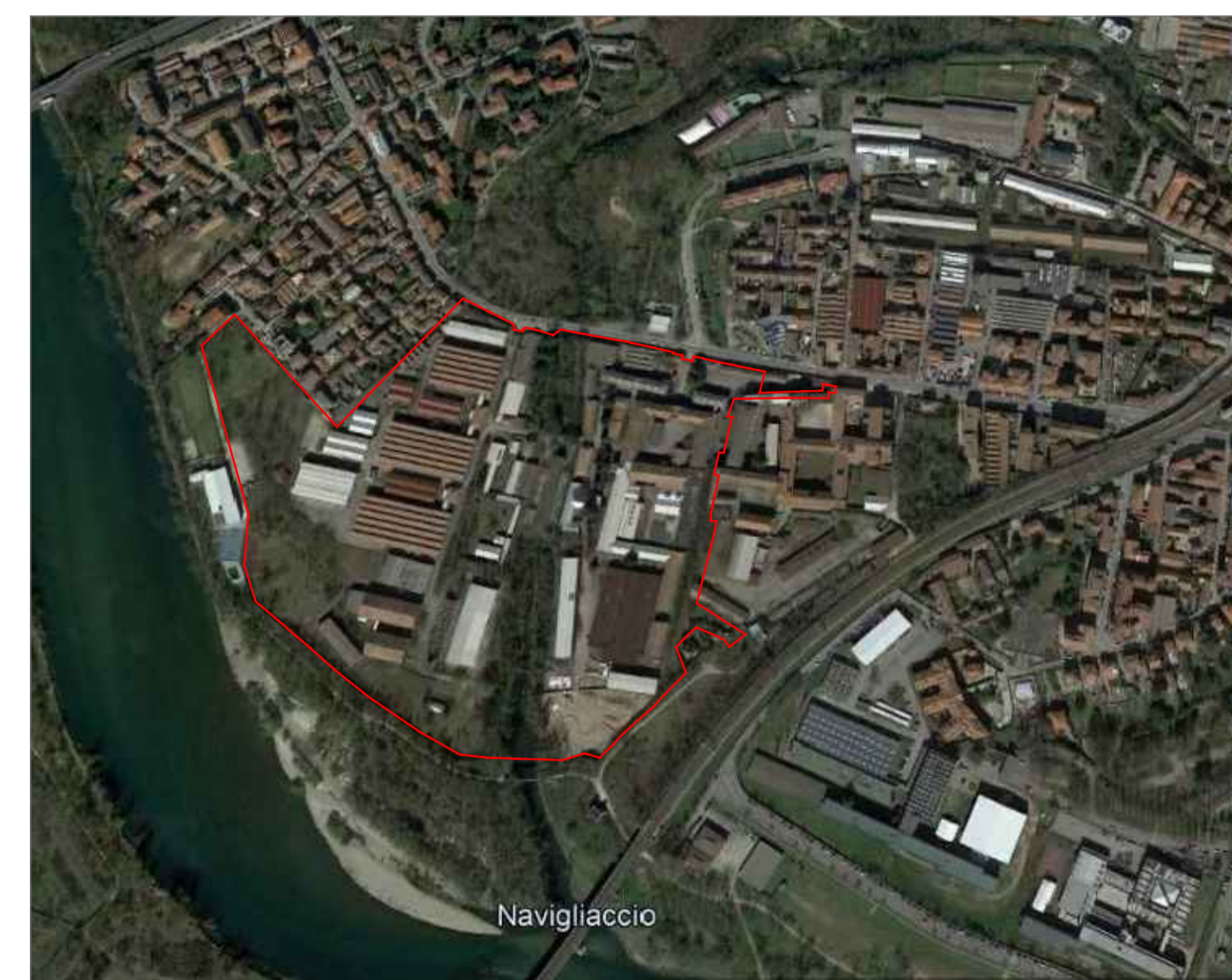
VISTA DEL COMPLESSO