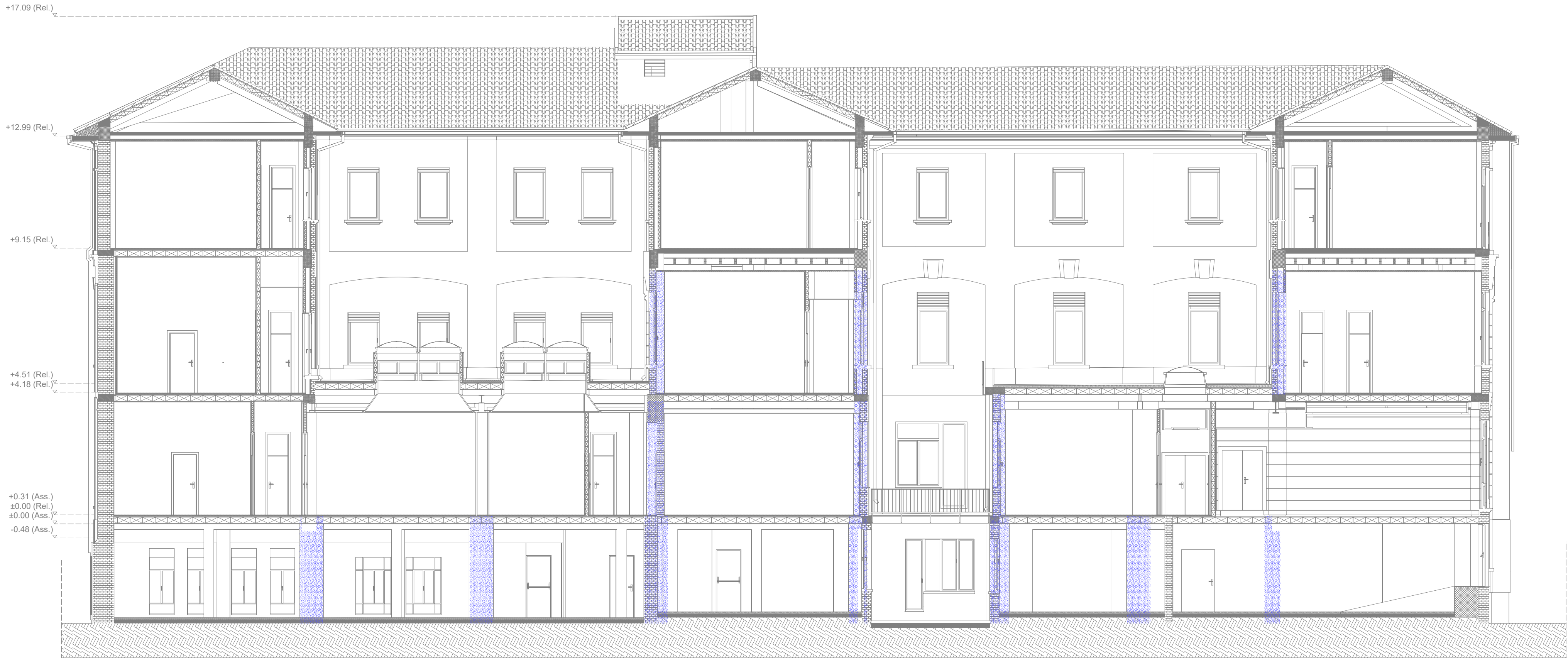
Prospetto Sud 1

LA PROPRIETÀ DI QUESTO ELABORATO APPARTIENE ALL'AGENZIA DEL DEMANIO. ESSO NON PUÒ ESSERE COPIATO, RIPRODOTTO E TRASFERITO IN ALCUN MODO, SENZA L'ESPLICITA AUTORIZZAZIONE SCRITTA DELL'AGENZIA DEL DEMANIO.