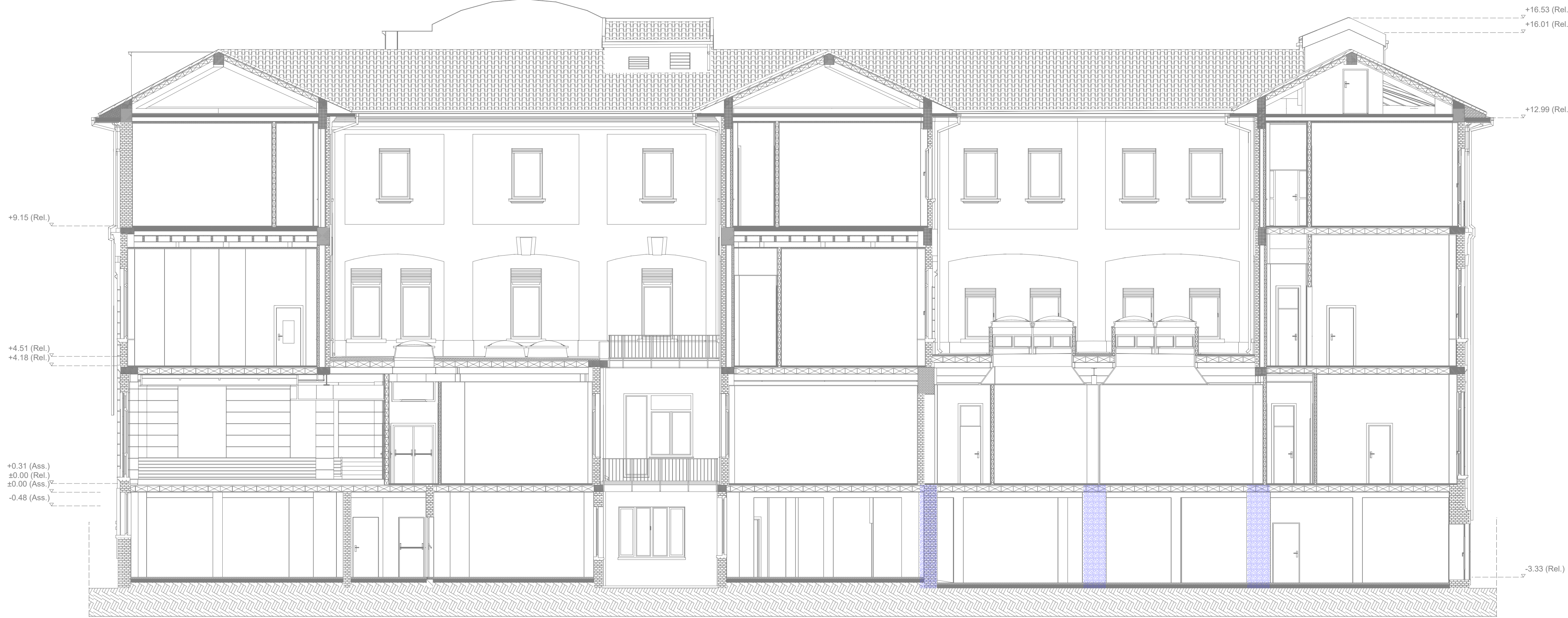
Prospetto Nord 1