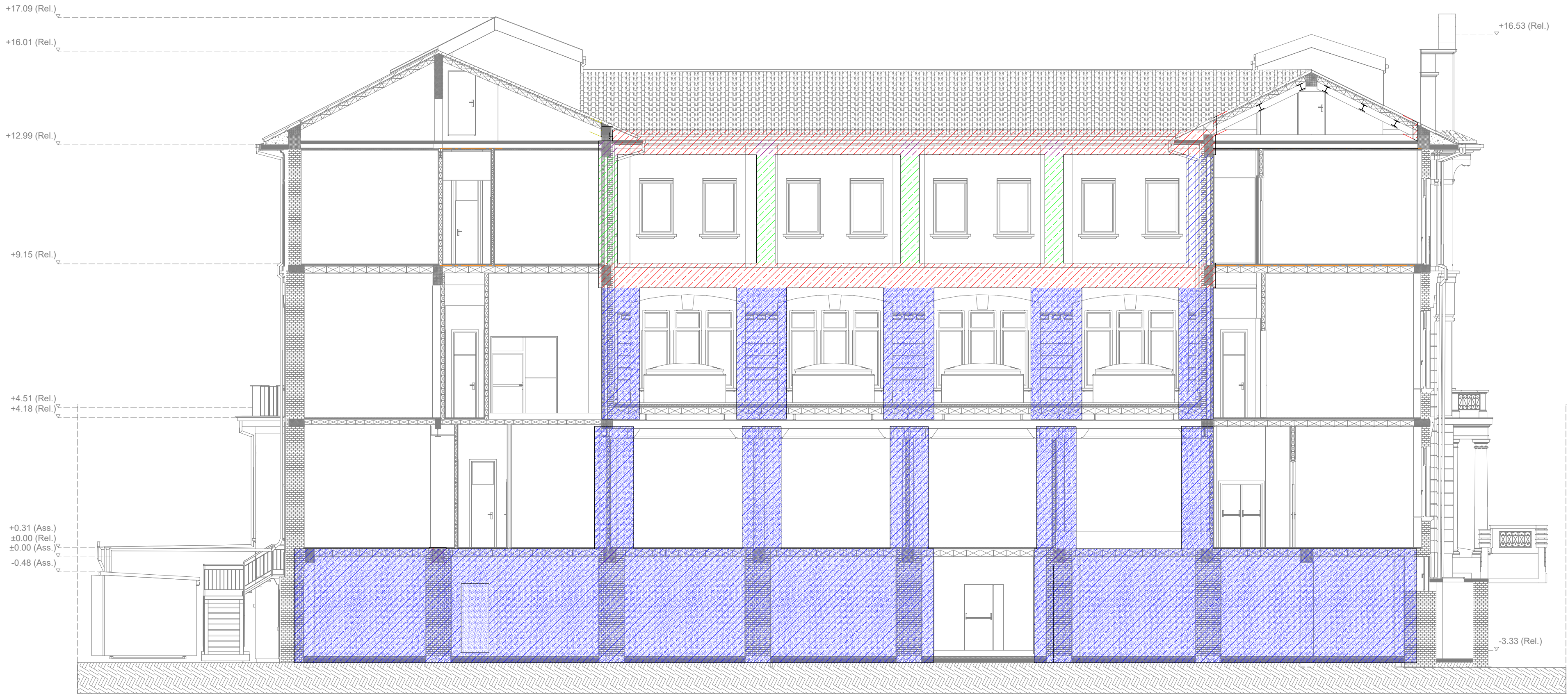
Prospetto Ovest 1

LA PROPRIETÀ DI QUESTO ELABORATO APPARTIENE ALL'AGENZIA DEL DEMANIO. ESSO NON PUÒ ESSERE COPIATO, RIPRODOTTO E TRASFERITO IN ALCUN MODO, SENZA L'ESPLICITA AUTORIZZAZIONE SCRITTA DELL'AGENZIA DEL DEMANIO.