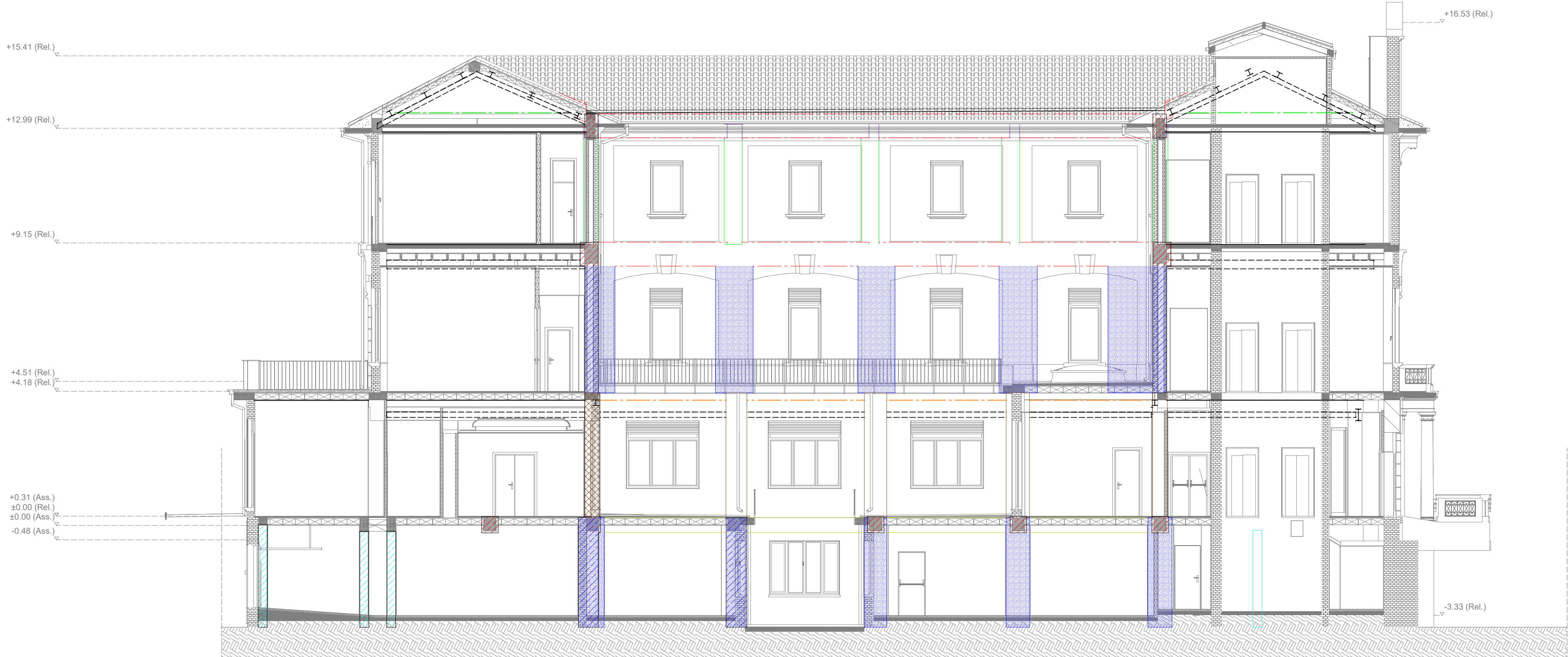
Prospetto Ovest 2