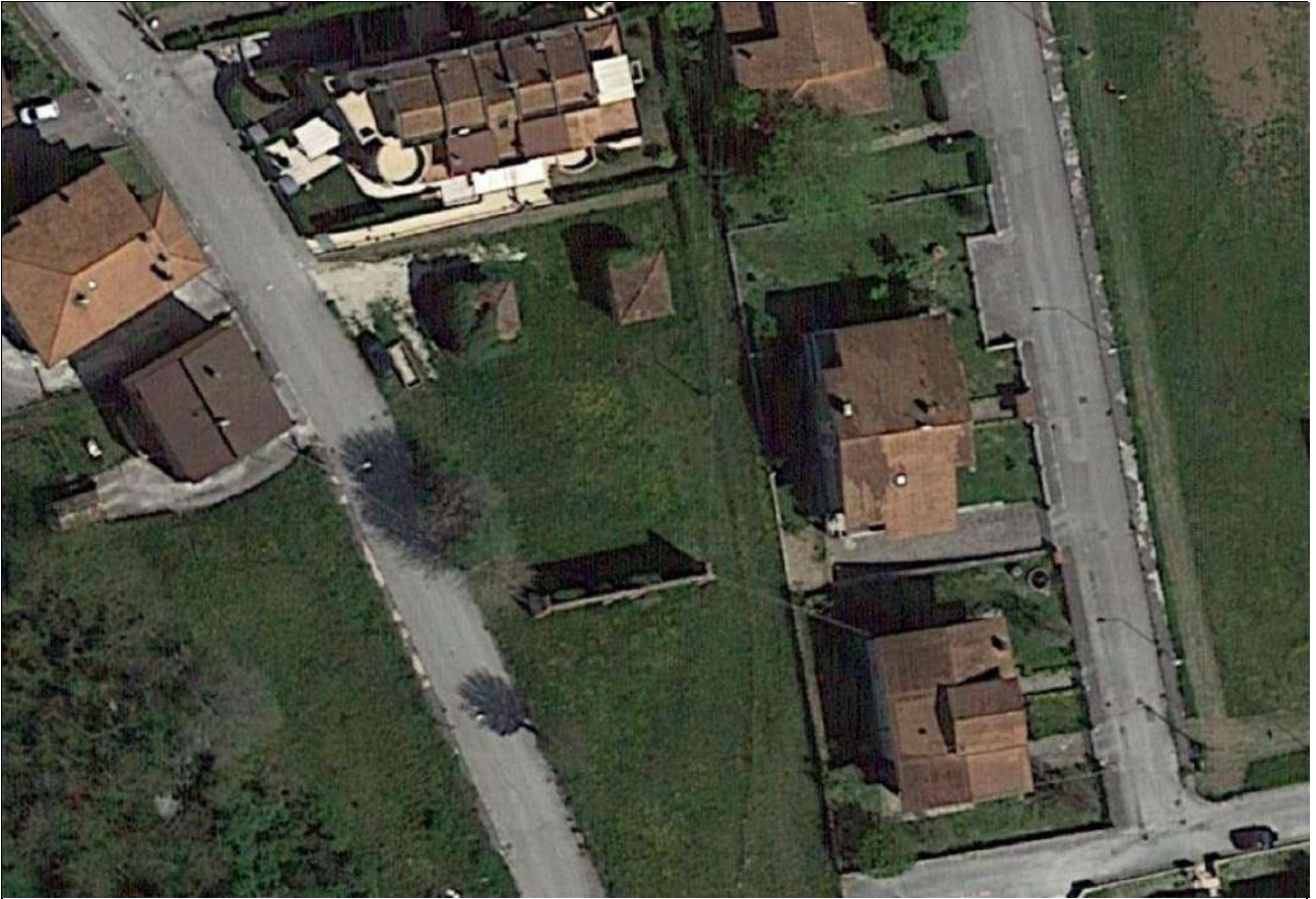
VEDUTA AEREA DELL'AREA DI INTERVENTO