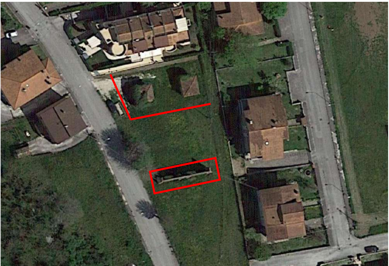
Posizionamento della recinzione di sicurezza (offset di 5 metri dai 2 magazzini – 2 metri dal setto murario con archi)