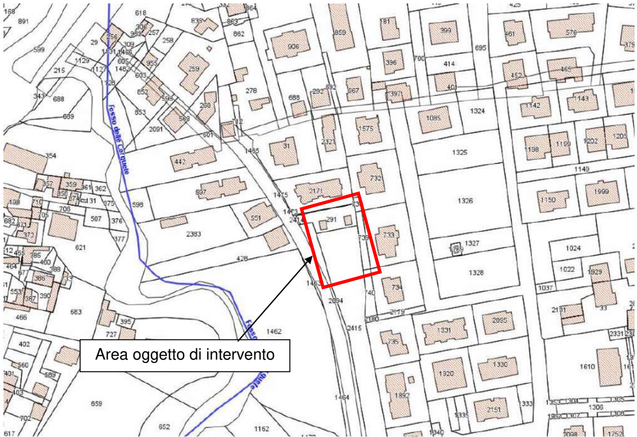
Estratto mappa catastale