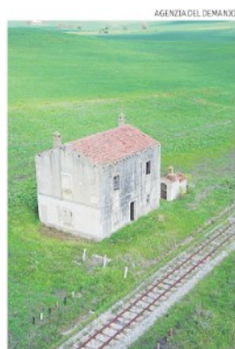
AGENZIA DEL DEMANIO A gara. Cantoniera sulla via Appia