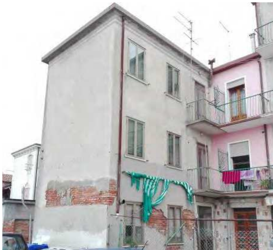
Lungomare Lusenzo, via San Felice 549/C – Chioggia (VE)