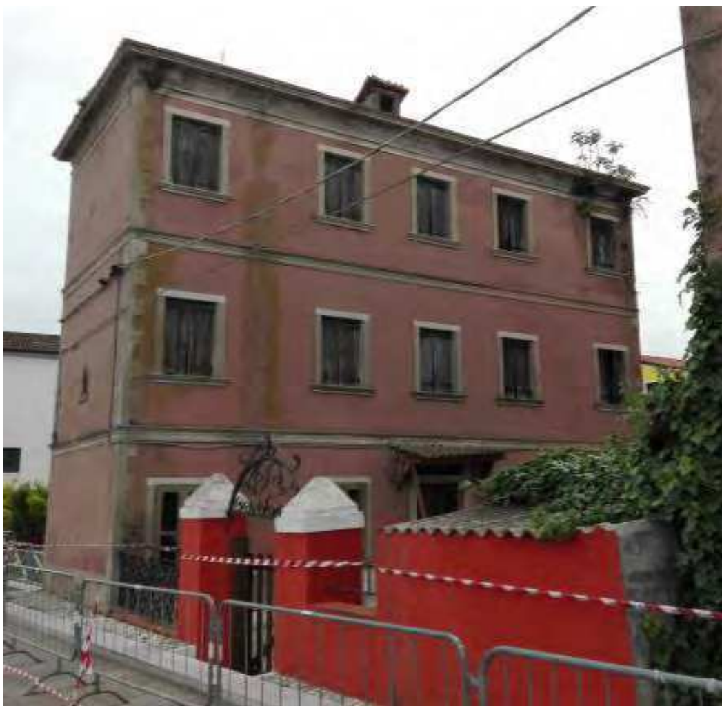
Lungomare Lusenzo – Via Foxia n. 2031 Chioggia (VE)