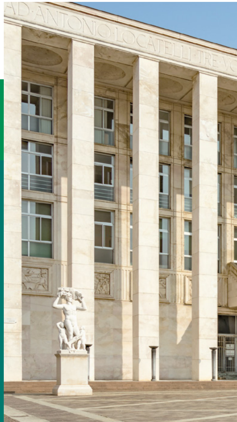
Palazzo della Libertà, Bergamo

Scarica il Rapporto Annuale dell'Agenzia del Demanio