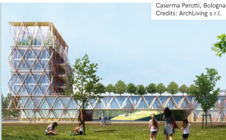
Caserma Perotti, Bologna