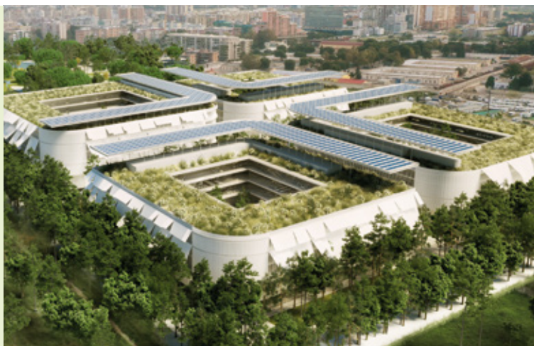
Parco della Giustizia di Bari Progetto di Atelier(s) Alfonso Femia e rendering/immagine di Atelier(s) Alfonso Femia & Diorama