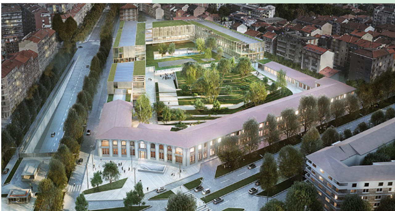
Caserma Amione, Torino

Credits: RT Paolo Iotti Marco Pavarani architetti associati, F&M divisione impianti s.r.l. e F&M ingegneria S.p.a.