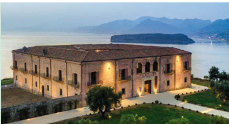
Palazzo dei Principi Lanza di Trabia, San Nicola Arcella (Cosenza)